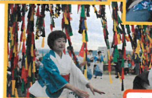
大野中学校職場体験