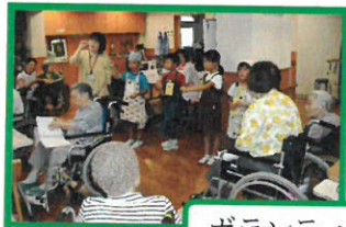
ボランティア学園